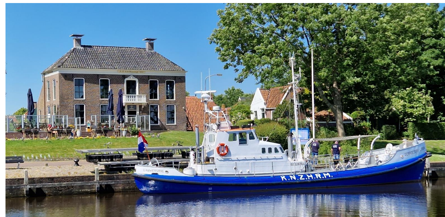
De Gebroeders Luden voor café Hammingh in Garnwerd

De Gebroeders Luden te water gelaten, is nog altijd in originele staat en behoort inmiddels tot het historisch varend erfgoed. Nadat de reddingboot in 2006 uit dienst ging, heeft de 'Stichting tot behoud reddingboot Gebroeders Luden' haar van de KNRM gekocht zodat het schip op Lauwersoog kon blijven en voor het publiek toegankelijk werd. Met de opbrengst van de tochten en met financiële hulp van onze donateurs en sponsoren, wordt de Gebroeders Luden door een groep enthousiaste vrijwilligers zorgvuldig onderhouden. Help ons mee het schip in goede conditie te houden en word donateur voor minimaal € 35,00 per jaar. Stuur een mail naar info@gebroeders-luden.nl of kijk op www.gebroeders-luden.nl