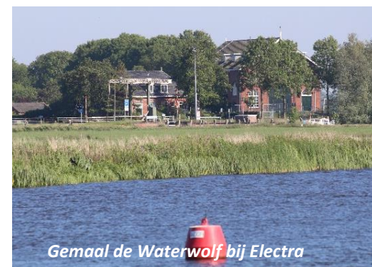
Gemaal de Waterwolf bij Electra