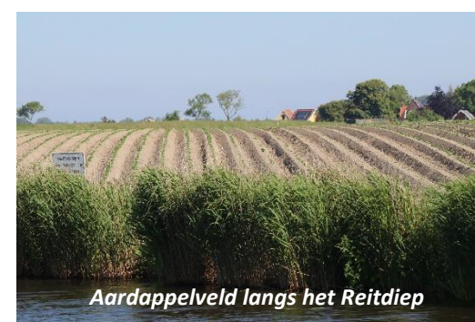
Aardappelveld langs het Reitdiep

Het komt niet vaak voor dat we gebeld worden voor een tocht van Wierumerschouw naar Lauwersoog (enkele reis). Met lunch aan boord graag. Op één dag van Lauwersoog naar Wierumerschouw en weer terug halen we net niet in verband met de sluitstijden. Dus hebben we onze gasten bij café Hammingh in Garnwerd aan boord genomen. Het was prachtig weer en onze gasten genoten zichtbaar van de tocht en de lunch. Het Reitdiep is geen onbekend vaarwater voor ons en varen over het Reitdiep geldt ook voor onze zeerotten als een erg mooie tocht. Zachtjes glijden we tussen de weilanden door; de dorpen en de kerken herkennen we op afstand. In veel akkers zijn de aardappelen gepoot, de voren haaks op het water en gekromd over het glooiende land. We passeren het gemaal de Waterwolf uit 1920, één van de grootste in Nederland en nog altijd functionerend. In de oevers en op het water is het een drukte van belang met allerlei vogels. Vooral de Rietgors liet zich goed horen. Er is veel te zien en te horen; een tocht over het Reitdiep in het voorjaar is zeer aan te bevelen. Een erg mooi stukje van het Lauwersmeer is de Zoutkamperril. Dat is het laatste gedeelte voor dat je bij Zoutkamp bent. Hier staat het water zo ongeveer op hetzelfde niveau als het aansluitende weiland. Geen dijk, geen oeverwal; land gaat gewoon over in het water. En vaak liggen er van die mooie koeien aan de waterrand of zijn ze aan het pootje baden. Prachtig!