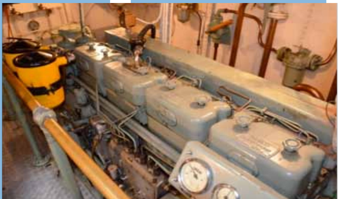
machinekamer met de BB-motor, de 8 cilinders zijn duidelijk te zien evenals de gele brandstoffilters

Gaande de tijd krijg je toch wel steeds meer respect voor de mensen die met deze boten naar zee gingen terwijl anderen naar binnen gingen. Zeewaardig zijn ze zeker, maar een plezierjacht is het niet, er wordt wel het een en ander van spieren en maag gevraagd als de windkracht wat toeneemt.